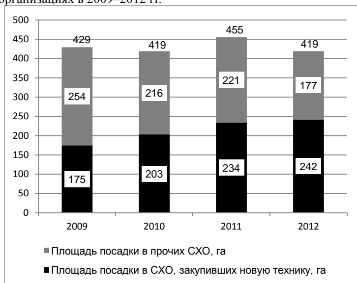
Диаграмма 1. Динамика изменения площадей посадок картофеля в сельскохозяйственных организациях в 2009–2012 гг.

При оказании государственной поддержки эти организации обеспечили динамичное развитие производственной деятельности в данном направлении. Приобретение современной техники позволило хозяйствам в короткие сроки в 1,4 раза нарастить площади посадки картофеля, в то время как в других сельхозорганизациях за прошедший период площади посадок сократились на треть.