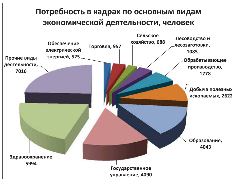
Рисунок 1. Потребность в кадрах по основным видам деятельности